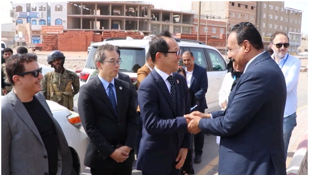
The Ambassador of Japan to Yemen, the Minister of Public Works and Highways visiting the rehabilitated road.

Aden, 24 June 2026 – The Government of Japan, the Ministry of Public Works and Highways, and UNOPS marked the completion of “The Project for Rehabilitation of Aden Intra-Urban Roads,” which rehabilitated 2.4 km of intra-urban road in central Aden.